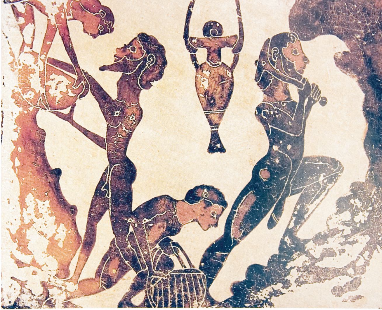
Antik Yunan'da köleler.

Toplum yerleşik hale gelip şehir devleti