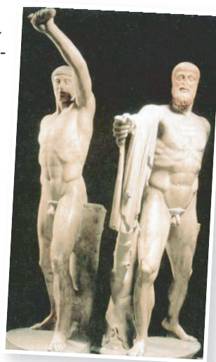
Harmodius ve Aristogeiton