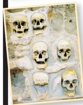
Niş'teki (Sırbistan) Kelle Kulesi