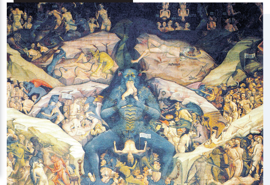
San Petronio Kilisesi'nin şapelindeki fresk

hilâl ve iki yanında da kafataslarından meydana getirilmiş küçük piramitler vardır ve kafatasları bu mevkide 1666'da katledilen Hristiyanlara aittir. Türklerin 1809'da Sırlarla girdiği savaş sonuna, Türk zaferi ansısına 1024 kelleden mürekkep bir kellekule dikilmiştir.