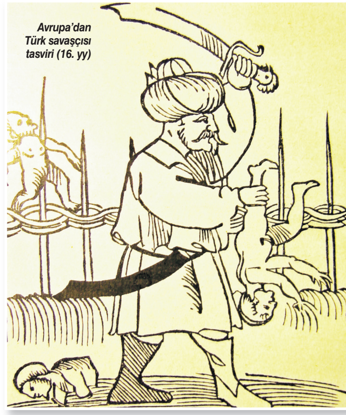
Avrupa'dan Türk savaşçısı tasviri (16. yy)