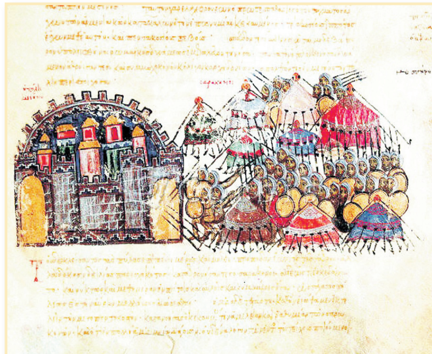
Sicilya'nın Araplar tarafından fethi

İstanbul'un fethi arifesinde doruk noktasına çıkan bu anlatılara bir örnek de Kritovoulos'a (1410-1470) aittir. Kritovoulos, şiddetli depremlerin ve toprak kaymasının, ardı arkası kesilmeyen şimşeklerin ve çokça yağın yağmurlardan mey-